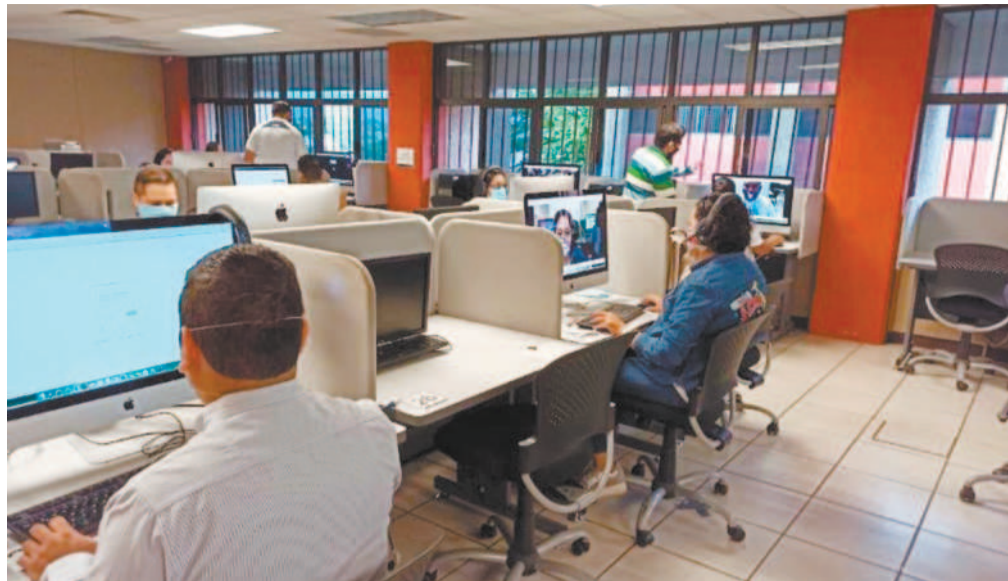
©Prueba virtual. Personal docente y administrativo monitoreó a los aspirantes, quienes realizaron el examen desde su casa, debido a las recomendaciones por la pandemia del COVID-19.

“En la familia estamos muy emocionados y orgullosos de él, desde los abuelitos tíos y demás. Todos lo conocen y saben que siempre ha sido inteligente y dedicado en sus labores educativas”, comentó.