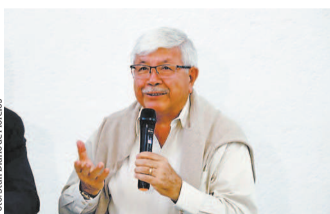
Harán comités de Participación de Salud Escolar.