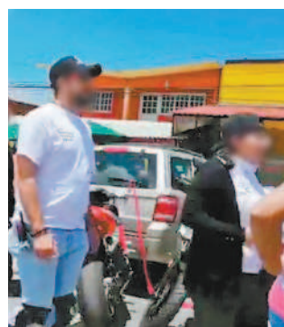
©En Tres Marías. Motociclistas no siguen las recomendaciones de salud para evitar contagios.

Sin embargo, los visitantes no cuidaron ninguna de las medidas de prevención dispuestas ante la epidemia por el Coronavirus SARS CoV-2, principalmente el uso de cubrebocas ni la sana distancia.