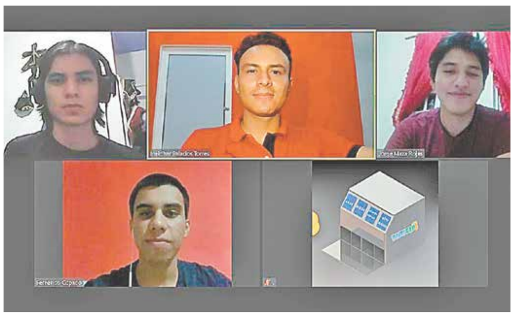
En video conferencia. Los jóvenes proyectaron el desarrollo del producto, vía remota.

EDITOR: CRISTINA RAMIREZ LOCAL@DIARIODEMORELOS.COM