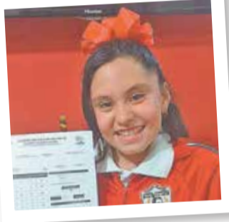
trabajos, ese es mi secreto para el éxito” comentó.